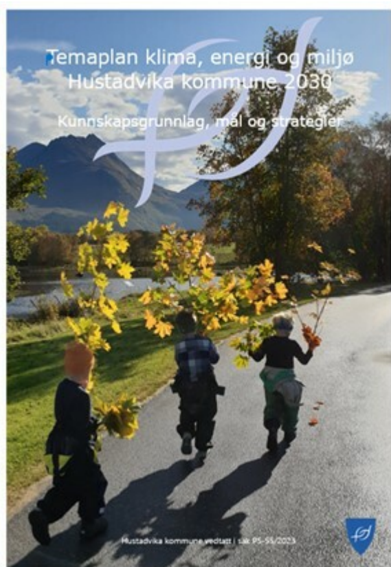
Temaplan klima, energi og miljøplan

Samfunnet forventer at kommunene tar en aktiv rolle og er pådrivere for et ambisiøst klima-, energi- og miljøarbeid. Temaplan for klima, energi og miljø 2030 er Hustadvika kommunes svar på disse forventningene.