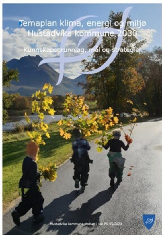
Temaplan klima, energi og miljøplan

Samfunnet forventer at kommunene tar en aktiv rolle og er pådrivere for et ambisiøst klima-, energi- og miljøarbeid. Temaplan for klima, energi og miljø 2030 er Hustadvika kommunes svar på disse forventningene.