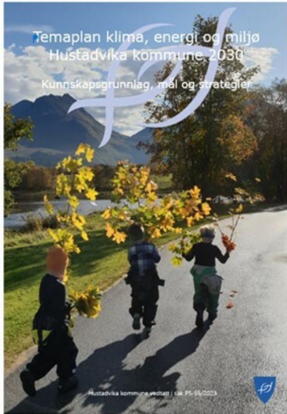
Temaplan klima, energi og miljøplan

Samfunnet forventer at kommunene tar en aktiv rolle og er pådrivere for et ambisiøst klima-, energi- og miljøarbeid. Temaplan for klima, energi og miljø 2030 er Hustadvika kommunes svar på disse forventningene.