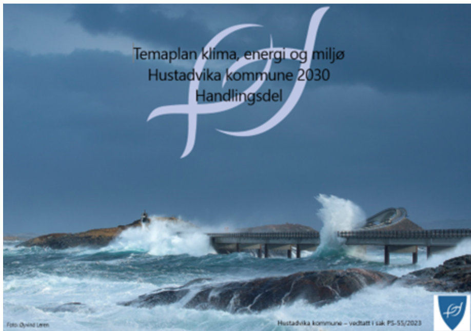
Temaplan klima, energi og miljø - handlingsdel