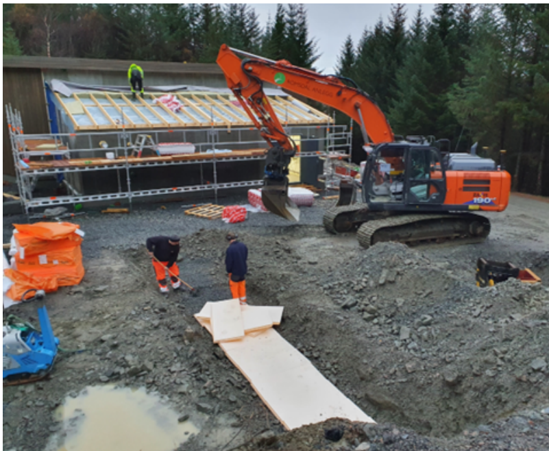
Høydebasseng på Freneidet skal være ferdig i september 2023