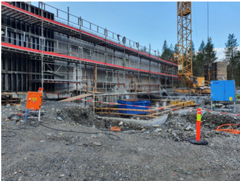
Nytt avløpsanlegg i Vikan