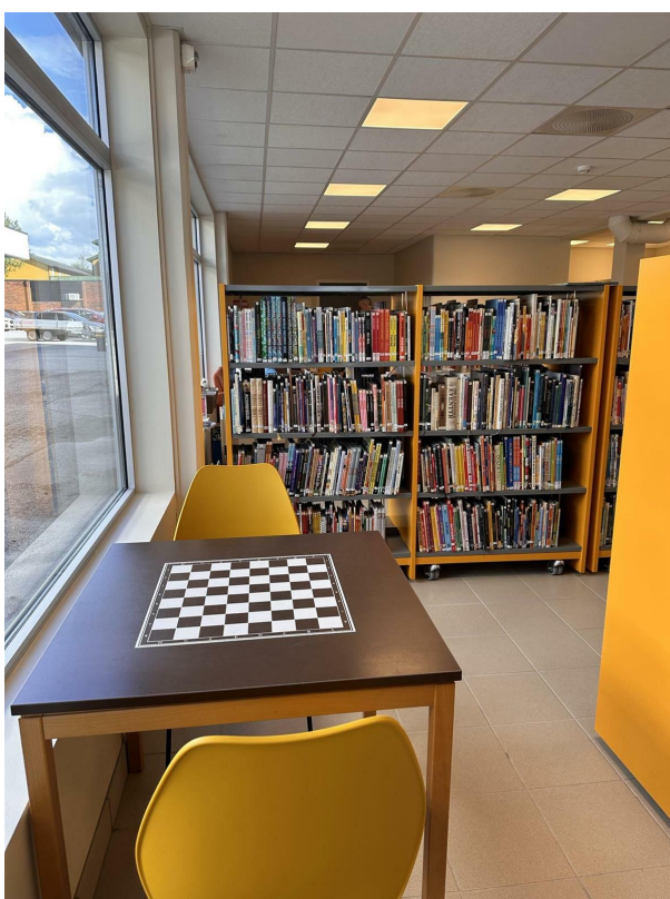
Muligheter for et slag med sjakk