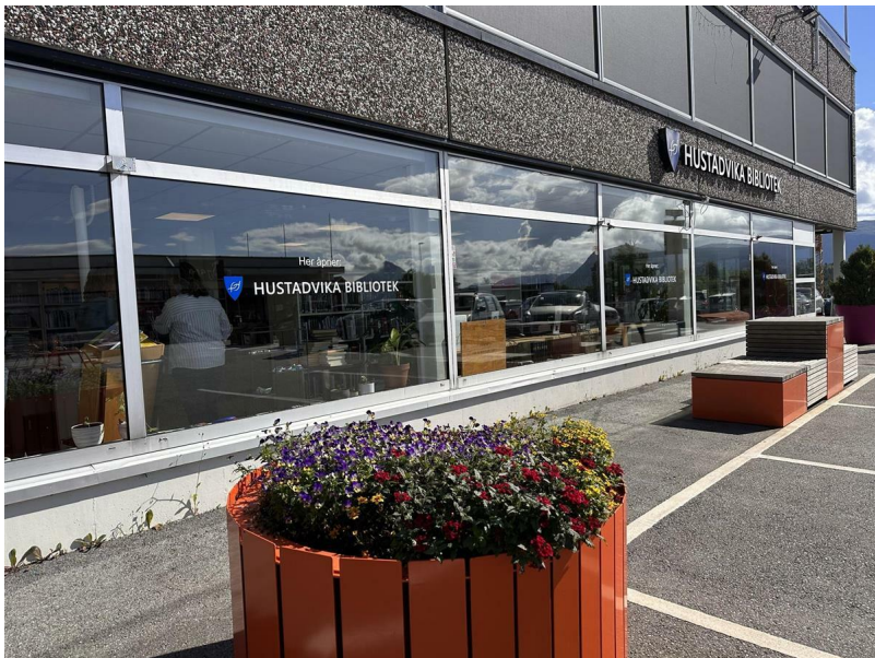
Nå finner du biblioteket på torget i Elnesvågen sentrum