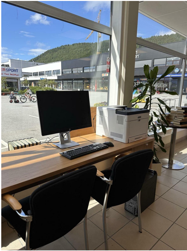
Låne-PC og skriver