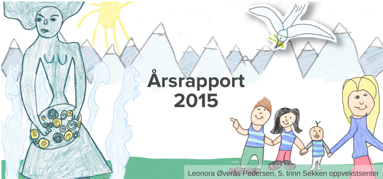
Leonora Øverås Pedersen, 5. trinn Sekken oppvekstsenter