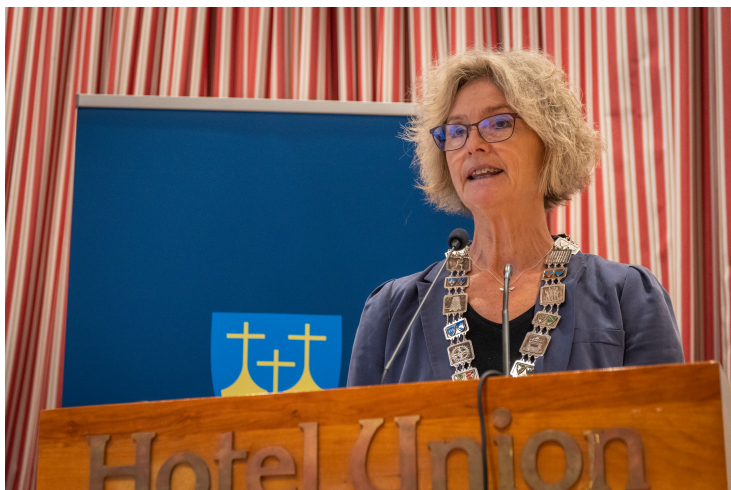
Fylkesordførar Tove-Lise Torve (Ap)