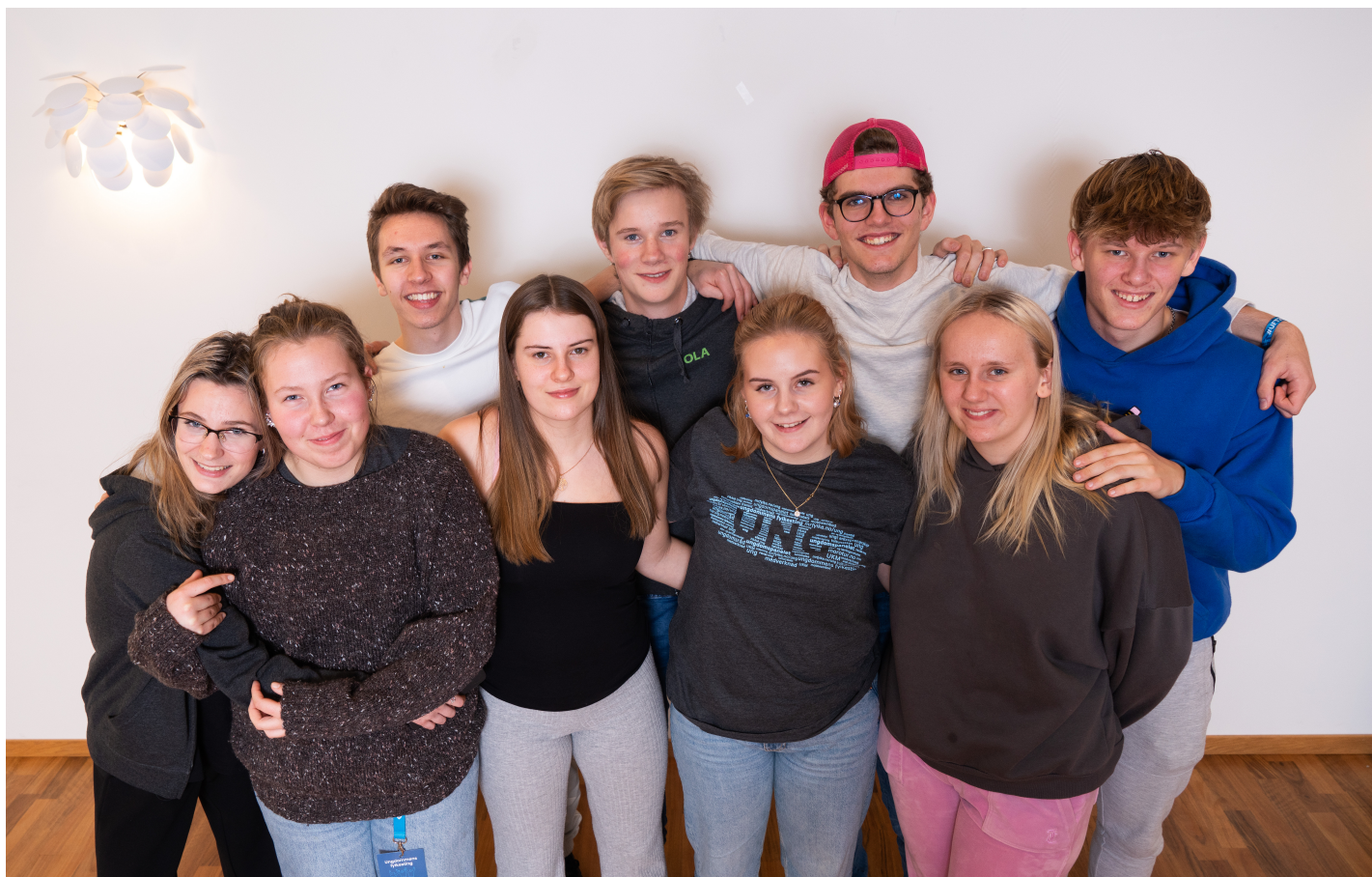
Ungdomspanelet 2022-2023