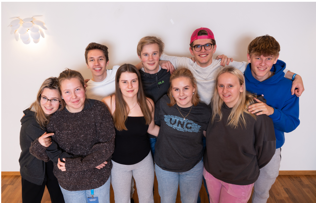
Ungdomspanelet 2022-2023